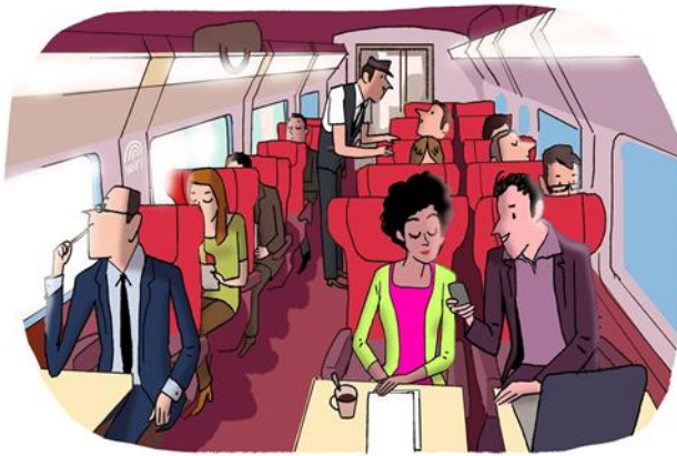
« Comfort » : le choix de l'espace (+30%) et du calme associé.

Avec sa nouvelle gamme, Thalys challenge son modèle historique. Standard / Comfort / Premium : derrière les noms qui changent, c'est une offre qui s'adapte aux besoins des voyageurs quel que soit leur motif de voyage, leur pays ou leur destination.