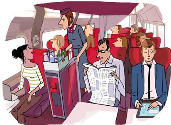
Premium : le meilleur de Thalys.

Avec cette nouvelle gamme, Thalys réaffirme son pari d'un service d'excellence pour les clients business et fréquents.